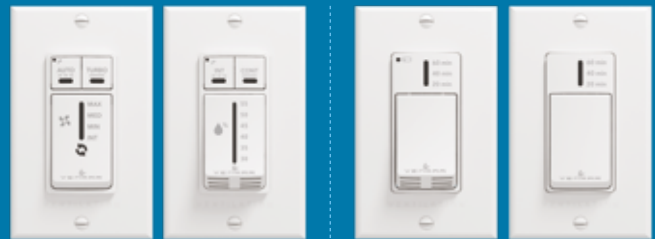
Commande automatique 41404